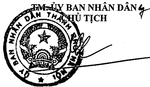
Nguyễn Đức Chung

Trên đây là Kế hoạch tuyển dụng công chức diện tiếp nhận không qua thi tuyển đối với Thủ khoa xuất sắc được Chủ tịch UBND Thành phố tặng Bằng khen vào làm việc tại sở, cơ quan ngang sở, UBND quận, huyện, thị xã thuộc thành phố Hà Nội năm 2016. Trong quá trình thực hiện nếu có vướng mắc, đề nghị các cơ quan, đơn vị phản ánh về thường trực Hội đồng thi tuyển công chức năm 2016 - Sở Nội vụ để được xem xét và giải quyết./.